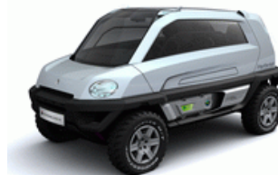
Magna Steyr MILA Alpin 2008