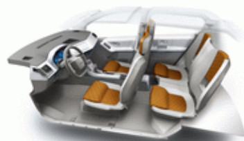
Magna Steyr MILA 2009

Acest prototip a fost precedat de o serie de alte modele tip prototip realizat din materiale ușoare, cum ar fi MILA 2008 Alpin prezentat tot la Salonul auto de la Geneva. Alpin este o mașină hibrid realizată ca un "tot-teren" de mici dimensiuni dar cu capacități dintre cele mai bune (inclusiv din punct de vedere al prețului, fiind realizat din materialele cele mai accesibile cu putință).