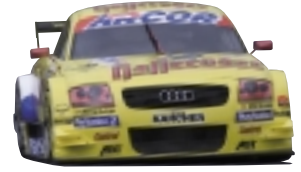
Christian Abt, Laurent Aiello, Mattias Ekström und Martin Tomczyk: Am Start in der DTM 2001 auf Abt Audi TT-R.