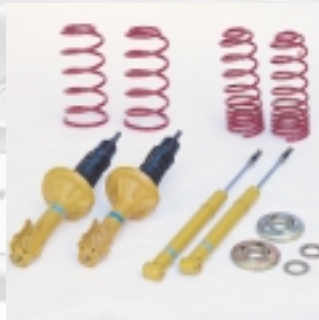
Abt Sportfahrwerk Tieferlegung ca. 25 bis 30 mm (nur Frontantrieb).