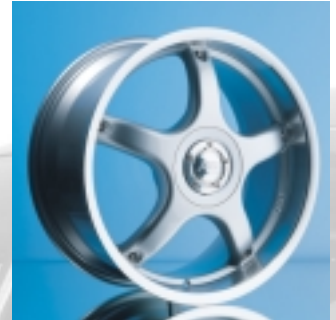
Abt Sportfelge A25 8,5 x 18 ET 35, einteilig, gegossen.