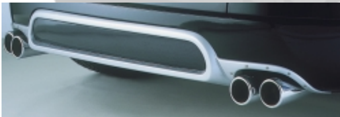
Abt Vierrohr-Auspuffanlage für Original-Heckschürze Edelstahlausführung, handgefertigt, Zweifach-Doppelrohr rund Ø 76 mm, mit graviertem Abt Logo inkl. Heckschürzen- aufsatz mit integrierten Schachtabdeckungen (silber). Extra: Abt Carbon-Blende für Heckschürzenaufsatz.