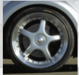
Abt Sportbremsanlage Vergrößerte Bremsscheiben (Durch- messer 322 mm), Vier-Kolben- Bremssättel (nur in Verbindung mit Abt Sportfelgen der Größen 17, 18 und 19 Zoll).