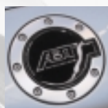
Abt Tankdeckel-Pad mit Abt Logo (chrom) selbstklebend.