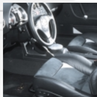
Abt Lederausstattung Feinnappa-Leder für zwei Vordersitze inkl. Kopfstützen, Rückbank inkl. Kopfstützen, vier Türverkleidungen vorne und hinten.