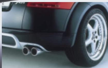
Abt Vierrohr-Auspuffanlage mit integrierter Abt Carbon-Blende und Abt Sportfelge A10.