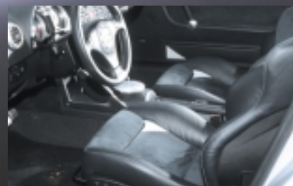
Die Abt Innenausstattung: Feinnappa-Leder und Alcantara sind die Werkstoffe.