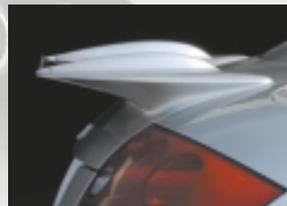
Abt Heckflügel mit integrierter Sichtcarbon-Lippe.