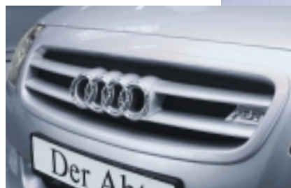
Der Abt Frontgrill für den TT mit zwei markanten Mittelstreben und Abt Logo.