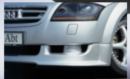
Die Abt Frontspoilerlippe (Schmalbau) für bessere Aerodynamik.