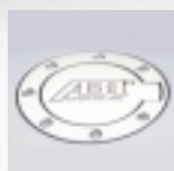
Abt Tankdeckel lasergraviert Aluminium, mit Abt Logo.