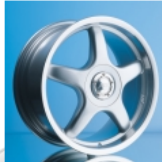
Abt Sportfelge A24 8 x 18 ET 35, einteilig, gegossen.