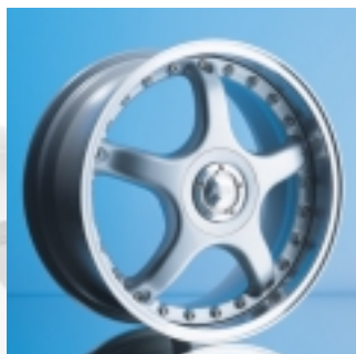
Abt Sportfelge A26 8,5 x 18 ET 35, zweiteilig, gegossen.