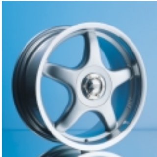
Abt Sportfelge A23 7,5 x 17 ET 30, einteilig, gegossen.