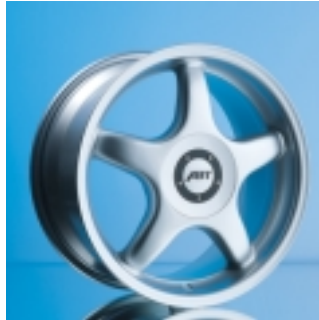
Abt Sportfelge A11 8 x 17 ET 35, einteilig, gegossen.