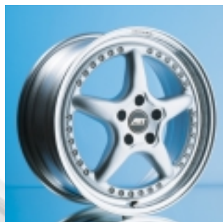
Abt Sportfelge A10 8,5 x 18 ET 29, dreiteilig, geschmiedet.