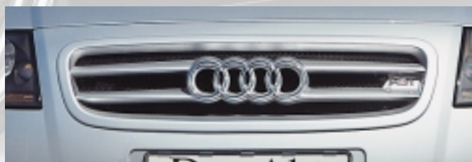
Abt Frontgrill mit zwei markanten Mittelstreben und Abt Logo.