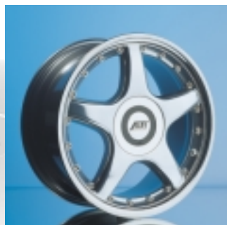
Abt Sportfelge A16 8 x 17 ET 32, zweiteilig, gewichtsoptimiert, Verbindungsschrauben Titan.