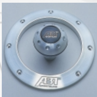
Abt Schaltknopf mit Schaltkulissenring Aluminium, mit Abt Logo.