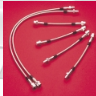
Abt Stahlflexbremsleitungen Komplettsatz für vorne und hinten. Immer optimaler Druckpunkt, kein Fading, weniger Pedalkraft, opti- maler Schutz gegen Steinschlag und Scheuern, hervorragende Dosierbarkeit.