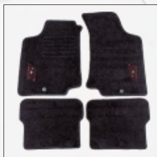
Abt Fußmatten Vierteilig, mit gesticktem Logo.