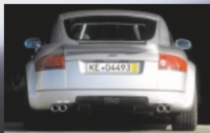
Ein Blick sagt mehr als tausend Worte (Foto Abt TT mit Bausatz).