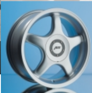
Abt Sportfelge A13 7 x 16 ET 35, einteilig gegossen