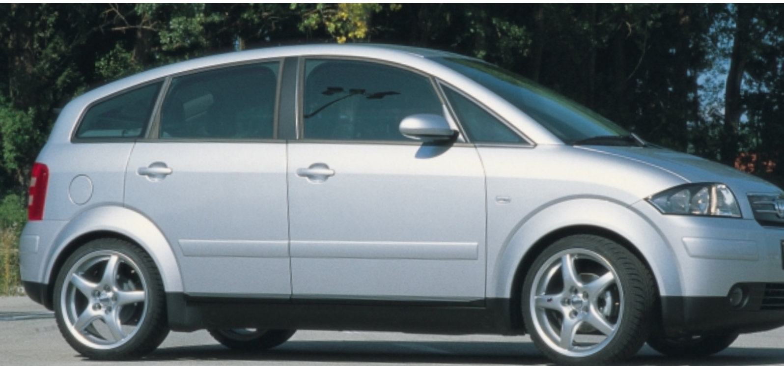
Abt Sportfelge Z3, 7,5 x 17

Kein Auffallen um jeden Preis, sondern wohltuendes Abheben von der Menge – das sind die Ziele, die Abt mit seinem Zubehörprogramm für den A2 verfolgt. Die klassischen Abt Sportfelgen im Fünf-Speichen-Design, dezente optische Elemente, Fahrwerk und Aluminium-Interieur geben dem kleinsten Audi das besondere Etwas mit auf den Weg.