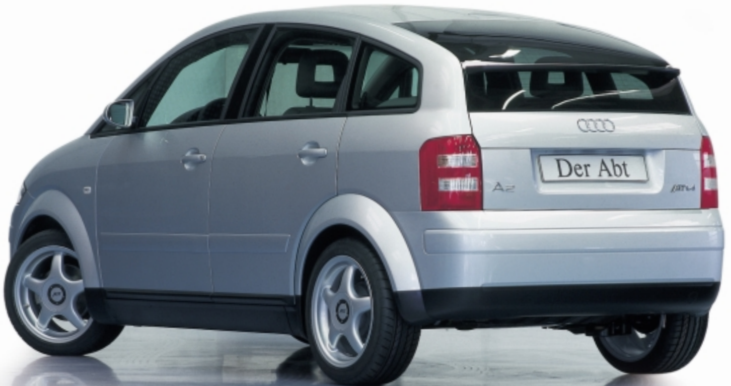
Abt A2 mit Sportfelge A13

So viel Sport muss sein. Der Abt in der DTM 2001.