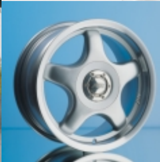
Abt Sportfelge A21 7 x 15 ET 35, einteilig gegossen