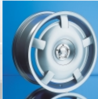
Abt Sportfelge V1 7x17 ET 30 einteilig gegossen