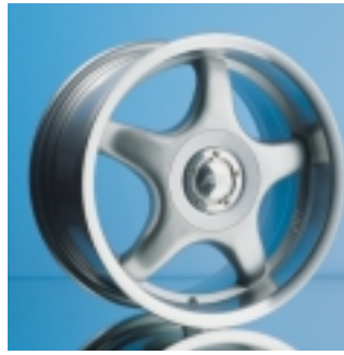
Abt Sportfelge A22 7,5 x 16 ET 30, einteilig gegossen

Sportfelgen vom Abt werden Sie begeistern. Und überzeugen. Das typische Fünf-Speichen-Design, das bestechende Finish in Qualität und Optik. Optimales Gewicht gewährleistet bestmögliches Handling – dafür stehen wir mit unserem Namen. Abt.