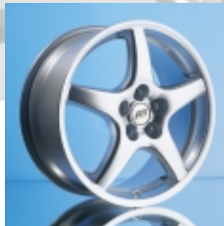
Abt Sportfelge Z1/Z3 7 x 16 ET 38 bzw. 7,5 x 17 ET 38 einteilig gegossen