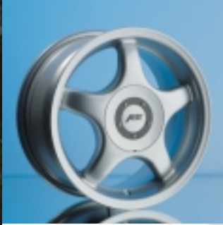
Abt Sportfelge A15 7 x 15 ET 35, einteilig gegossen