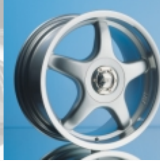
Abt Sportfelge A23 7,5 x 17 ET 30, einteilig gegossen