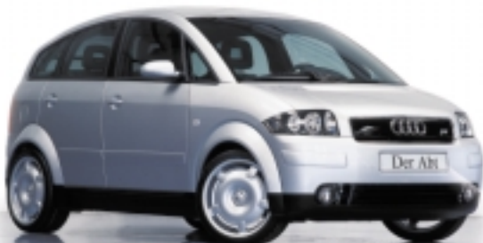
Abt A2 mit Sportfelge V1