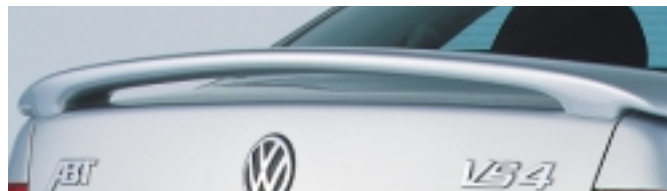
Abt Heckflügel (Limousine)