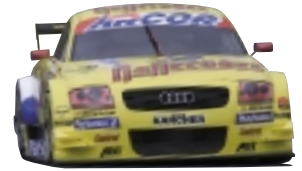
Christian Abt, Laurent Aiello, Mattias Ekström und Martin Tomczyk: Am Start in der DTM 2001 auf Abt-Audi TT-R.