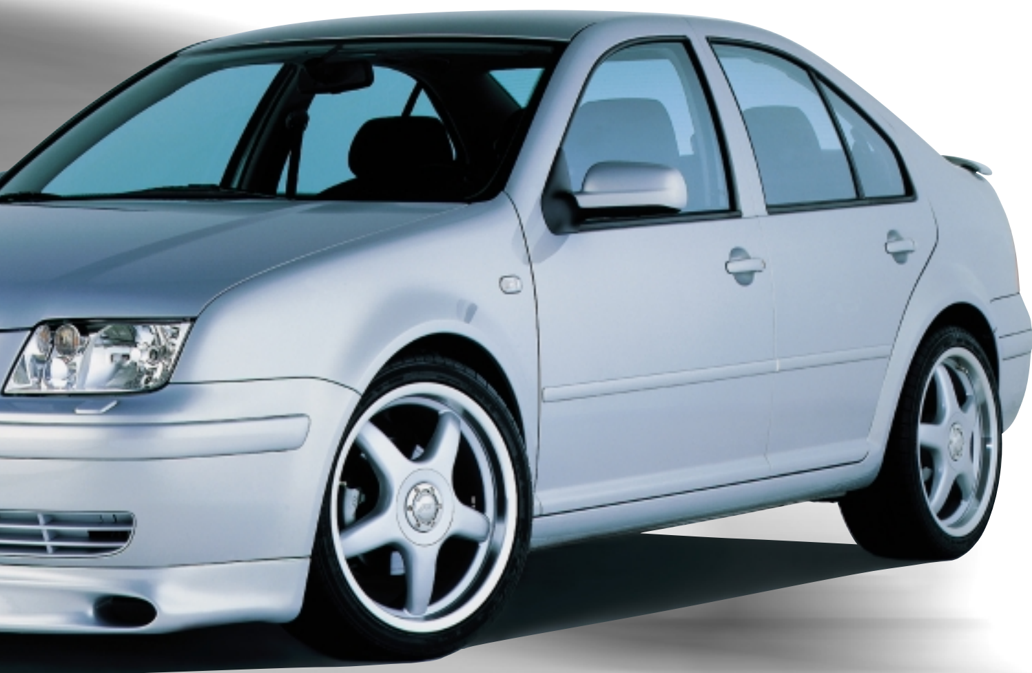
Abt Sportfelge A25 8,5 x 18 ET 35 einteilig gegossen.