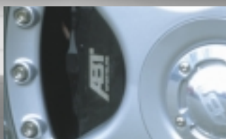
Abt Sportbremsanlage Vergrößerte Bremsscheiben, 4-Kolben-Bremssättel (nur in Verbindung mit Abt Sportfelgen 17", 18" oder 19" Zoll).

Von der Strecke für die Straße. Abt liefert die Qualität für diese Aufgabe: Überzeugende Technik bis ins kleinste Detail, höchste Materialgüte und Präzision bei der Verarbeitung – Abt Fahrwerke überzeugen auf der Straße.