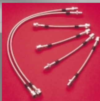
Abt Stahlflexbremsleitungen Kompletsatz für vorn und hinten: Immer optimaler Druckpunkt, weniger Fading, weniger Pedalkraft, optimaler Schutz gegen Steinschlag und Scheuern, hervorragende Dosierbarkeit.