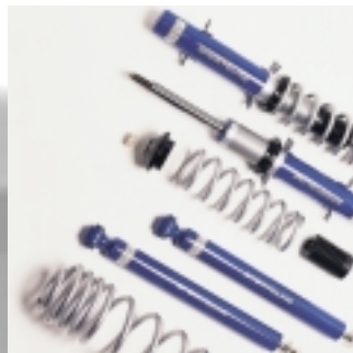
Abt Gewinde-Sportfahrwerk Tieferlegung bis max. 50 mm.

Von der Strecke für die Straße. Abt liefert die Qualität für diese Aufgabe: Überzeugende Technik bis ins kleinste Detail, höchste Materialgüte und Präzision bei der Verarbeitung – Abt Fahrwerke überzeugen auf der Straße.