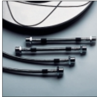
Abt Stahlflexbremsleitungen Kompletsatz für vorne und hinten. Immer optimaler Druckpunkt, weniger Fading, weniger Pedalkraft, optimaler Schutz gegen Steinschlag und Scheuern, hervorragende Dosierbarkeit.