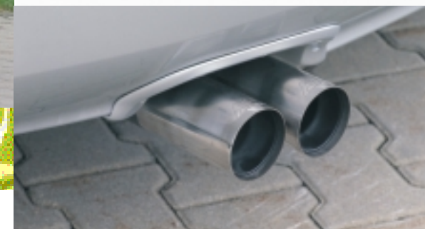
Abt Endschalldämpfer mit lackierter Schachtabdeckung