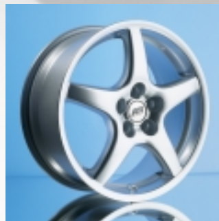
Abt Sportfelge Z1/Z3 7 x 16 ET 38 bzw. 7,5 x 17 ET 38 einteilig gegossen