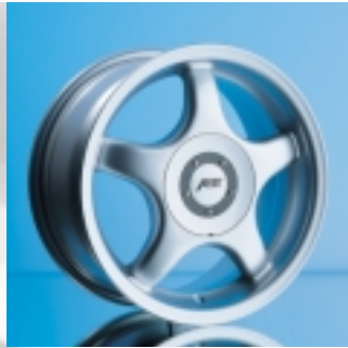
Abt Sportfelge A15 7 x 15 ET 35, einteilig gegossen

Sportfelgen vom Abt werden Sie begeistern. Und überzeugen. Das typische Fünf-Speichen-Design, das bestechende Finish in Qualität und Optik. Optimales Gewicht gewährleistet bestmögliches Handling – dafür stehen wir mit unserem Namen. Abt.