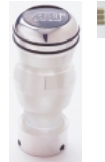
Abt Aluminium-Schaltknäuf Poliert. Abt Einstiegsleisten Für 4-Türer, Edelstahl, mit geprägtem Logo.