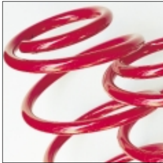
Abt Fahrwerkfedern Tieferlegung ca. 30 bis 35 mm.