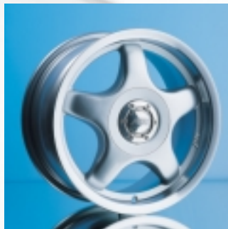
Abt Sportfelge A21 7 x 15 ET 35, einteilig gegossen