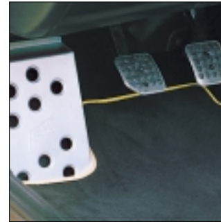
Abt Alu-Pedalerie und Alu-Fußstütze Aluminium mit Abt Logo.