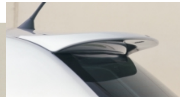
Abt Heckflügel für Limousine