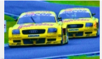
Christian Abt, Laurent Aiello, Mattias Ekström und Martin Tomczyk: Am Start in der DTM 2001 auf Abt-Audi TT-R.