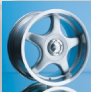
Abt Sportfelge A22 7,5 x 16 ET 30, einteilig gegossen