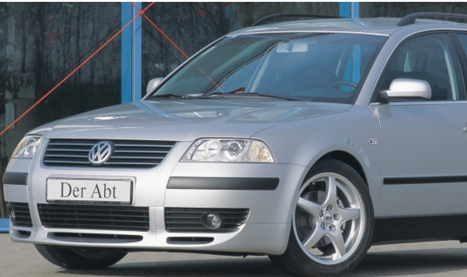
Abt Sportfelge A21 7 x 15 ET 35 einteilig, gegossen

Für den neuen Passat ab Baujahr 11/2000 bietet Abt ein komplettes Sortiment an Tuning-Teilen an. Für die Limousine ebenso wie für den Variant. Dazu zählen hochwertige Karosserie-Anbauteile, die die elegante Linienführung des Passat unterstreichen, ebenso wie eine Vielzahl an Interieur-Accessoires. Sieben verschiedene Leistungssteigerungen bis zu 195 kW (265 PS), sportlich abgestimmte Fahrwerke und Abt Sportfelgen runden die Palette ab.