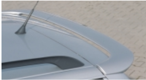
Abt Heckflügel (Variant)