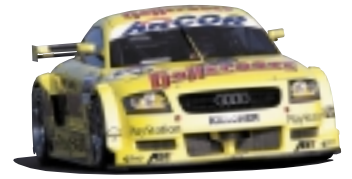
Christian Abt, Laurent Aiello, Mattias Ekström und Martin Tomczyk: Am Start in der DTM 2001 auf Abt-Audi TT-R.