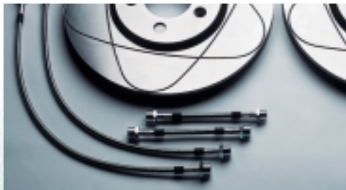
Abt Stahlflexbremsleitungen Komplettsatz für vorne und hinten. Immer optimaler Druckpunkt, weniger Fading, weniger Pedalkraft, optimaler Schutz gegen Steinschlag und Scheuern, hervorragende Dosierbarkeit.