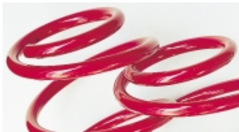
Abt Fahrwerksfedern Tieferlegung ca. 35 - 40 mm