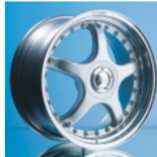
Abt Sportfelge A27 9 x 19 ET 35, dreiteilig, geschmiedet.

Sportfelgen vom Abt werden Sie begeistern. Und überzeugen. Das typische Fünf-Speichen-Design, das bestechende Finish in Qualität und Optik. Optimales Gewicht gewährleistet bestmögliches Handling – dafür stehen wir mit unserem Namen. Abt.