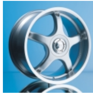
Abt Sportfelge A25 8,5 x 18 ET 35, einteilig, gegossen.