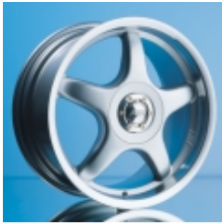
Abt Sportfelge A23 7,5 x 17 ET 30, einteilig, gegossen.