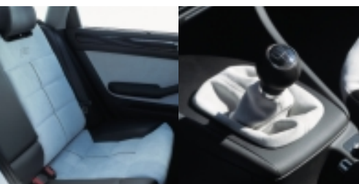
Abt Lederausstattung in individueller Ausführung, auf Wunsch in Abstimmung mit »Flammendesign«.