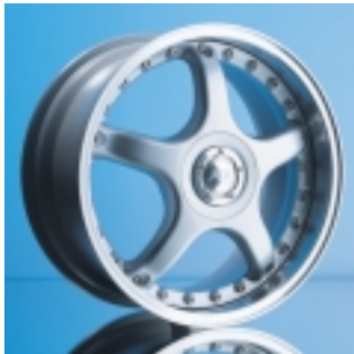
Abt Sportfelge A26 8,5 x 18 ET 35, zweiteilig, gegossen.